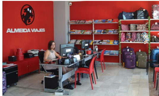
Agencia de Almeida Viajes con complementos para los viajeros.