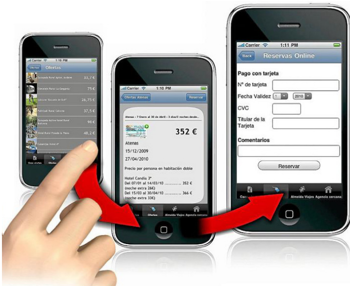
Recreación de la aplicación que el grupo Almeida Viajes ha creado para el iPhone.