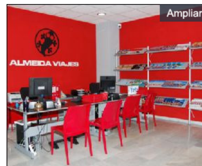
Oficina Almeida Viaje