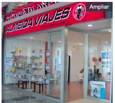
El Grupo Almeida Viajes ha abierto 48 nuevas agencias.